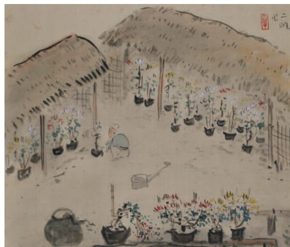
5 白倉嘉入《菊園図》紙本着色 31.4×36.5 cm