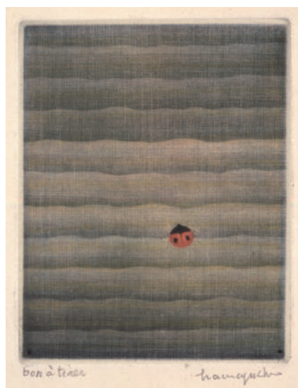
2 浜口陽三《てんとう虫》1960年 カラーメゾチント 10.0×7.9 cm