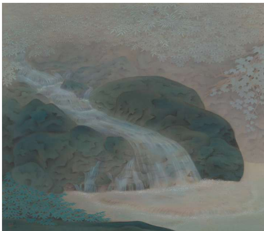
4 白倉嘉入《清溪図》年代不明 絹本着色 89.4×102.8 cm