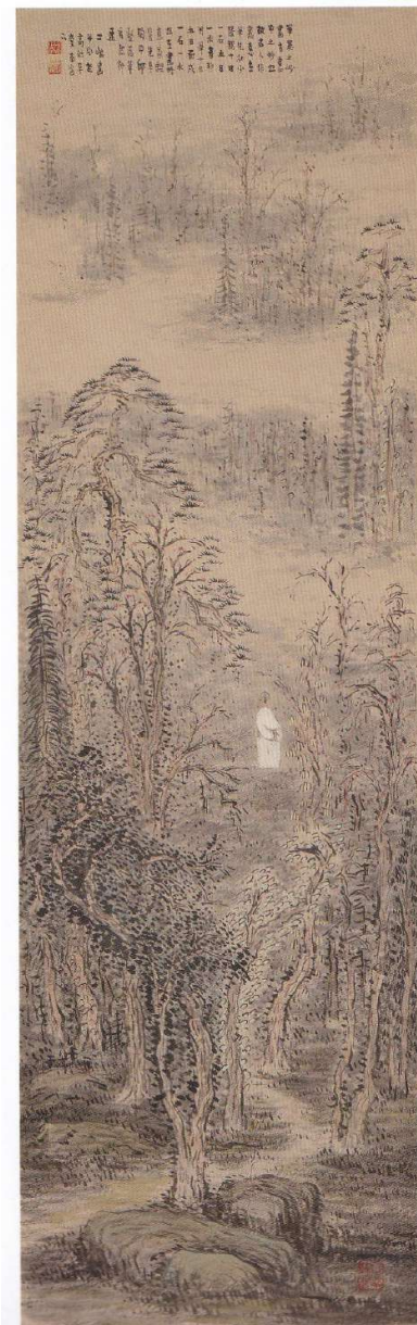
6 白倉嘉入《深林暮色図》年代不明 紙本着色 149.3×45.8 cm

二人の接点を想像しながらご鑑賞下さい。 白倉の初公開作品を含む約50点の構成です。 *白倉嘉入の作品には展示替えがあります。