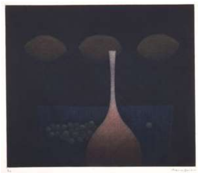
3 浜口陽三《びんとレモン》1957年 カラーメゾチント 29.4×34.4 cm