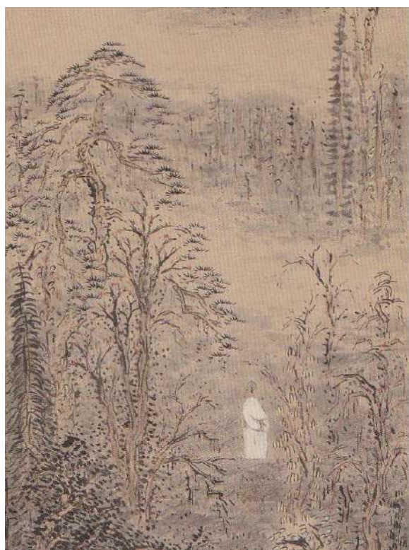
7 白倉嘉入《深林暮色図》年代不明 紙本着色【部分】 149.3×45.8 cm