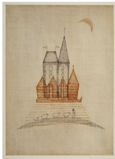
中央:《羊飼いの少女》1959年 エッチング、ドライポイント、ソフトグラウンドエッチング、 サンドペーパー 39.0×28.2cm Shepherdess Etching·Drypoint·Soft-Ground Etching·Sandpaper 右:《少女とシャボン玉》1981年 エッチング 35.2×28.4cm Girl and Soap Bubbles Etching