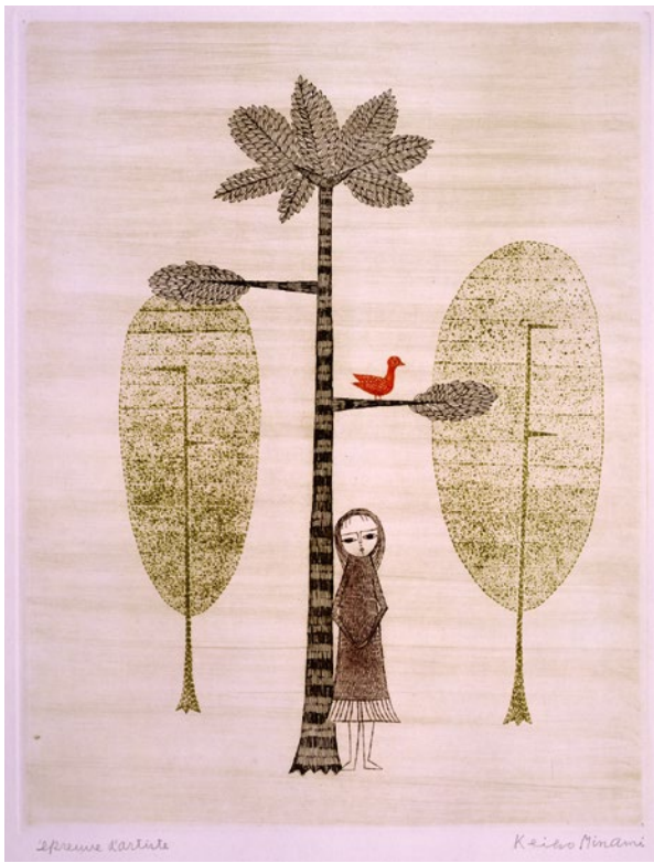
《少女と小鳥の木》1967年 エッチング、ソフトグラウンドエッチング、サンドペーパー 36.5×28.2cm Girl, Bird, and Trees Etching·Soft-Ground Etching·Sandpaper