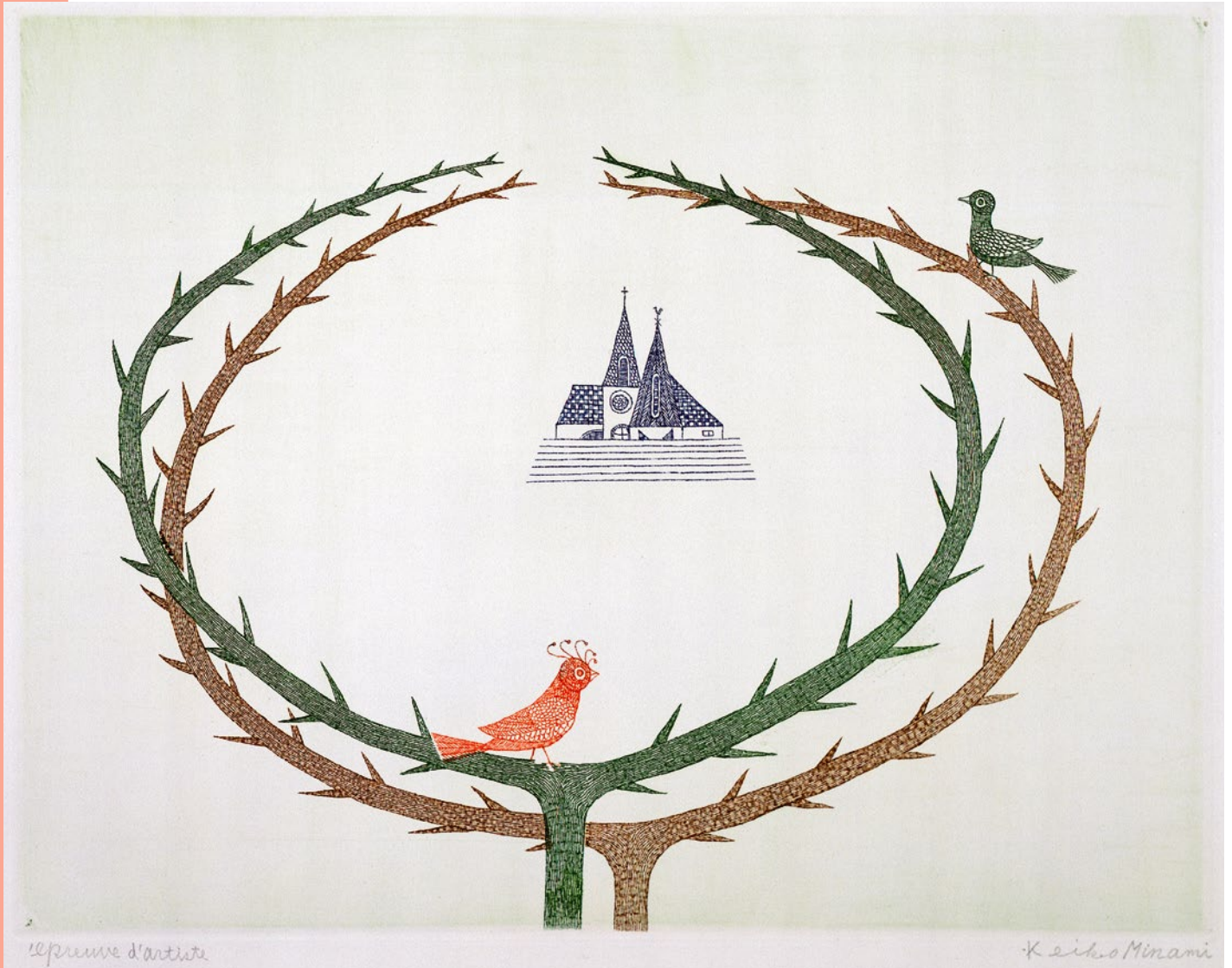
《春》1971年 エッチング、サンドペーパー 28.4×36.5cm Spring Etching-Sandpaper