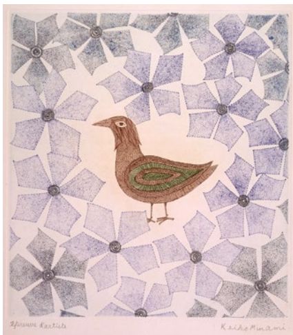
左:《鳥と花》1967年 エッチング、ドライポイント、サンドペーパー 31.9×29.7cm Bird and Flowers Etching·Drypoint·Sandpaper

銅版画家・南桂子(1911-2004)は富山県に生まれ、 高等女学校時代から絵画や詩作を試み、のちに20世紀を 代表する銅版画家となる浜口陽三との出会いをきっかけに、 1953年に渡仏、銅版画の世界で作品を作り続けました。 南桂子の作品は、透明感のある色で溢れています。 緑色1つにとっても、生命力溢れる木の緑や、 あたたかな背景の緑など細部まで気配りを感じます。 草木の芽吹く季節、優しい色彩の作品を中心に約50点展示します。 移りゆく世界の中で変わらない色をゆっくりとご鑑賞ください。