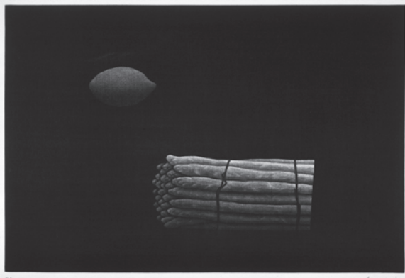
浜口陽三《アスパラガス》1957年 メゾチント 29.2×44.1cm

版画作品は、それぞれの時代の空気を帯びて、小説の中にかげがえのない存在感を放ちます。文学におけるメゾチントの感触を、浜口陽三のメゾチント作品と共にご鑑賞ください。