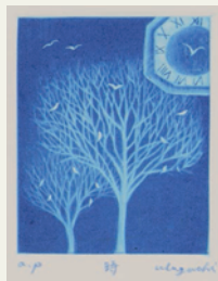
北村薫『ターン』の着想につながった作品