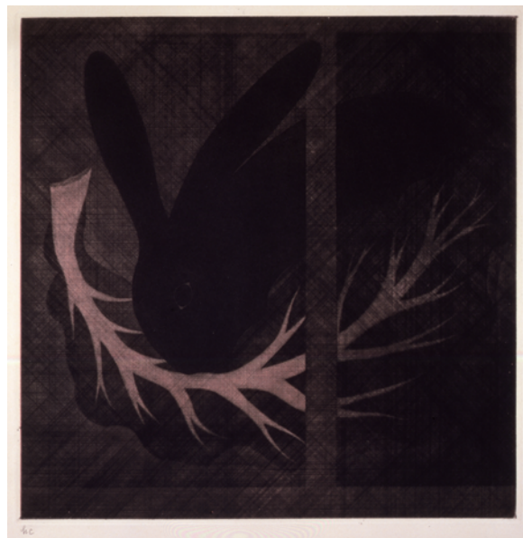
浜口陽三《うさぎ(ピンク)》1954年頃 29.3×29.2cm 銅版画(カラーメゾチント)