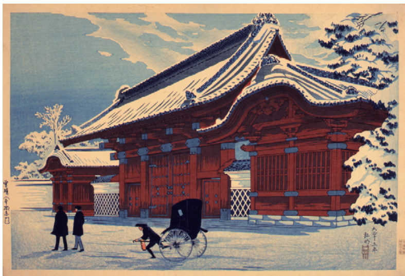
高橋松亭《雪晴》1925年 24.2×36.2cm 木版多色摺