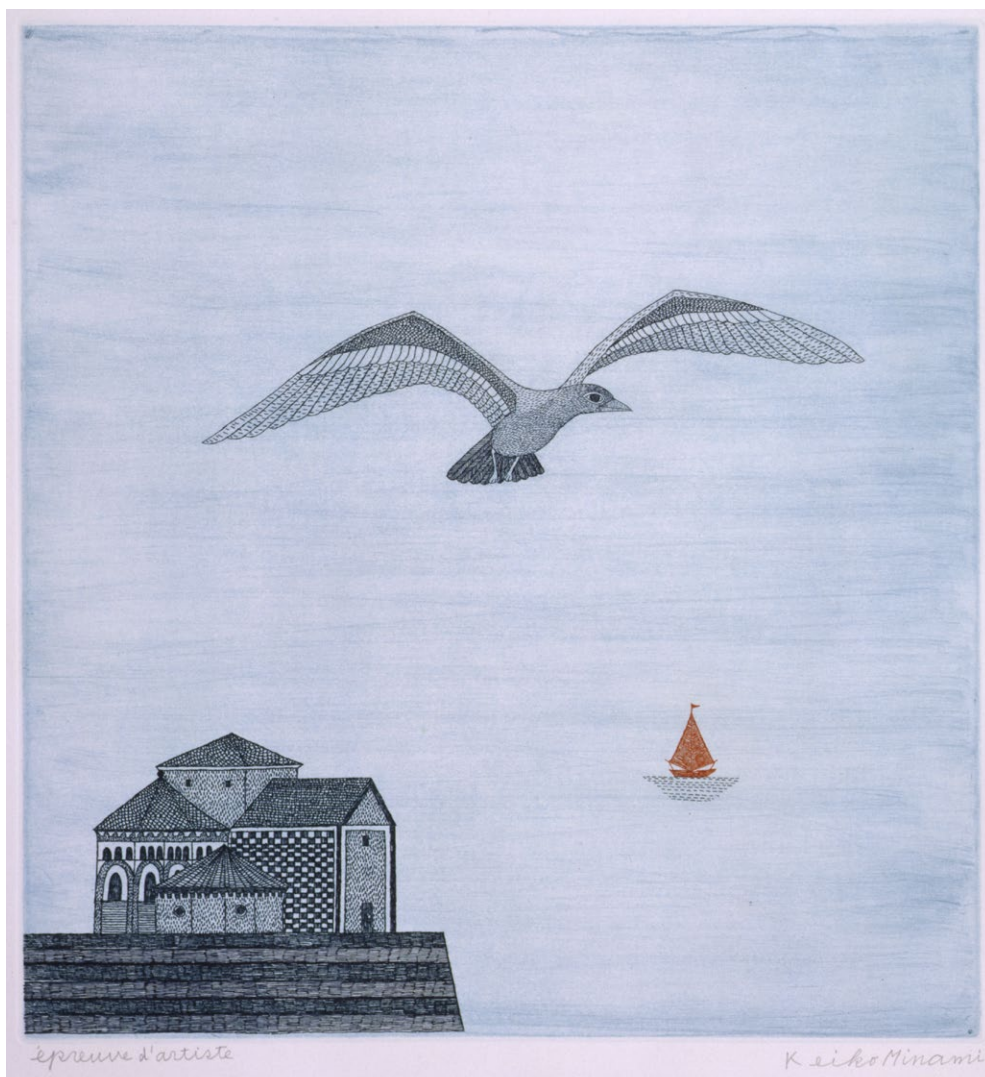
《かもめ》 1978年 32.0×28.5cm エッチング、サンドペーパー、紙