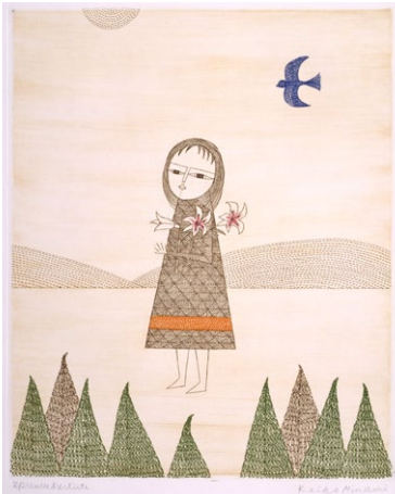
《少女と青い鳥》 1971年 35.4×28.8cm エッチング、ソフトグラウンドエッチング、サンドペーパー、紙

南桂子 / 1911年富山県高岡生まれ。高等女学校時代から油彩画制作や詩作に親しみ、戦後、後に世界的な銅版画家となる浜口陽三に出会って銅版画のおもしろさを知りました。1953年にフランスに渡り、それから40年余り作品を制作し続けました。小鳥や少女、お城などをモチーフにした詩的な銅版画は、いまでも国内外で愛されています。