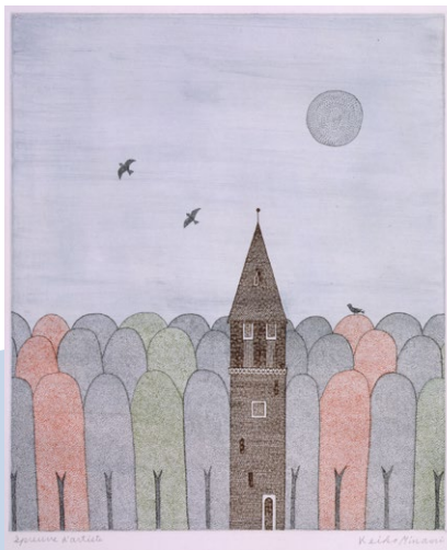
作品左:《森と塔》 1976年 34.3×28.5cm 技法はいずれも エッチング、サンドペーパー、紙

小川洋子 / 91年「妊娠カレンダー」で芥川賞受賞。著書は『博士の愛した数式』『密やかな結晶』『葉指の標本』『猫を抱いて象と泳ぐ』『琥珀のまたたき』はじめ多数。近著に『遠慮深いうたたね』(河出書房)『小川洋子の作り方』(田畑書店編)『掌に眠る舞台』(集英社)など。多くの作品は世界各国で翻訳されている。