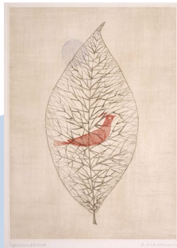
作品右:《落葉》 1959年 38.8×27.9cm