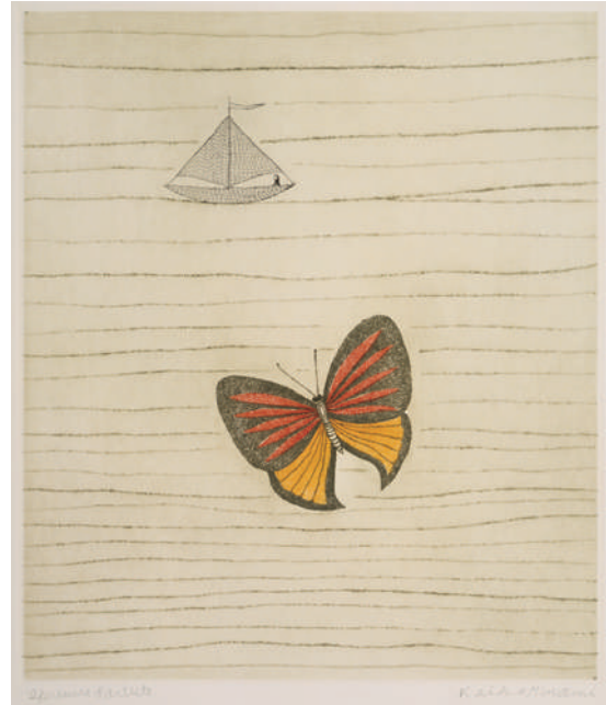
《蝶と水》 1963年 エッチング、ソフトグラウンドエッチング、サンドペーパー 34.0×29.2cm (後期)