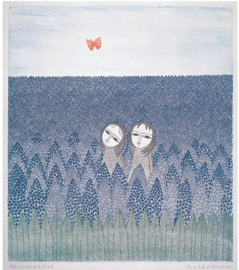
《2人の少女と蝶》 1979年 エッチング、サンドペーパー 32.0×28.3cm 〔通期〕