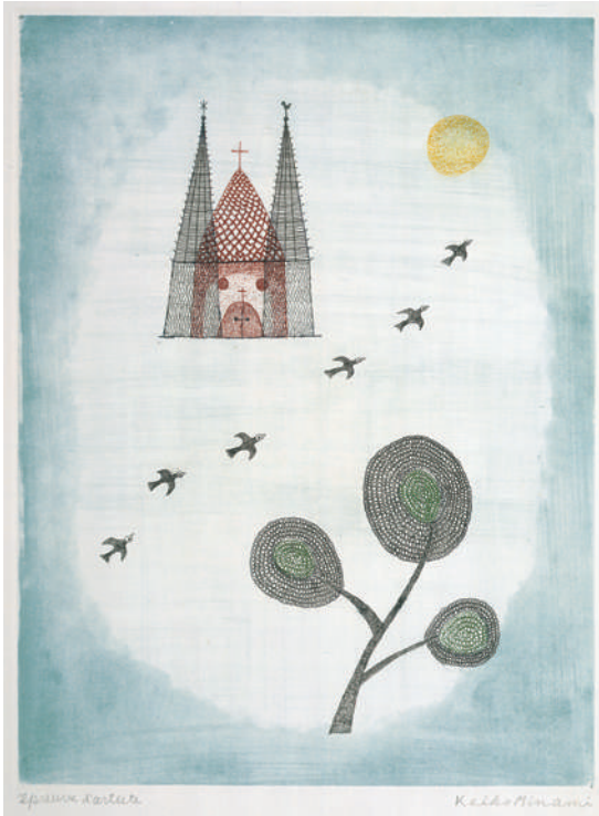
《街と6羽の飛ぶ鳥》 1963年 エッチング、ソフトグラウンドエッチング、スピットパイト、サンドペーパー 38.0×28.3cm (前期)