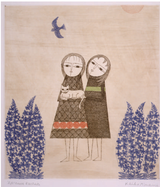
《2人の少女と猫》 1969年 エッチング、サンドペーパー 32.4×28.8cm (前期)