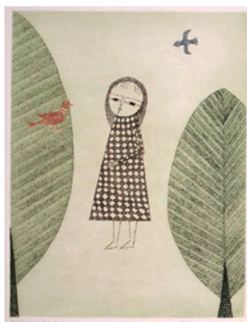
6「少女と木」1965年 36.8×28.2cm 銅版画・紙