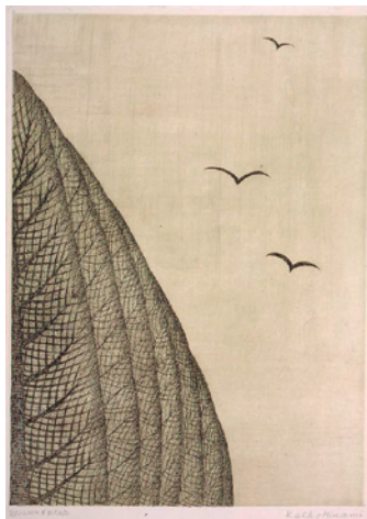
3「並木道」1961年 39.1×28.2cm 銅版画・紙