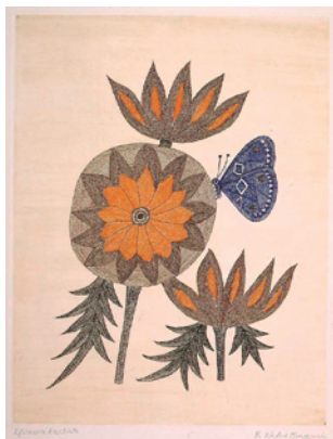
2「花と蝶」1969年 37.0×28.2cm 銅版画・紙