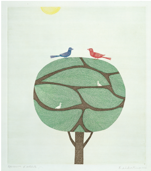
1 「みどり色の木」1975年 32.7×29.0cm 銅版画・紙