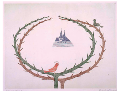
5「春」1971年 28.4×36.5cm 銅版画・紙