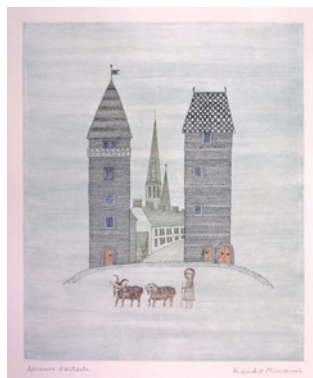
7「街の門」1967年 33.8×28.2cm 銅版画・紙