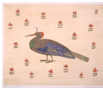
8「ブラジルの鳥」1972年 28.8×35.7cm 銅版画・紙