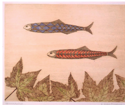
4「2匹の魚」1970年 28.9×35.3cm 銅版画・紙