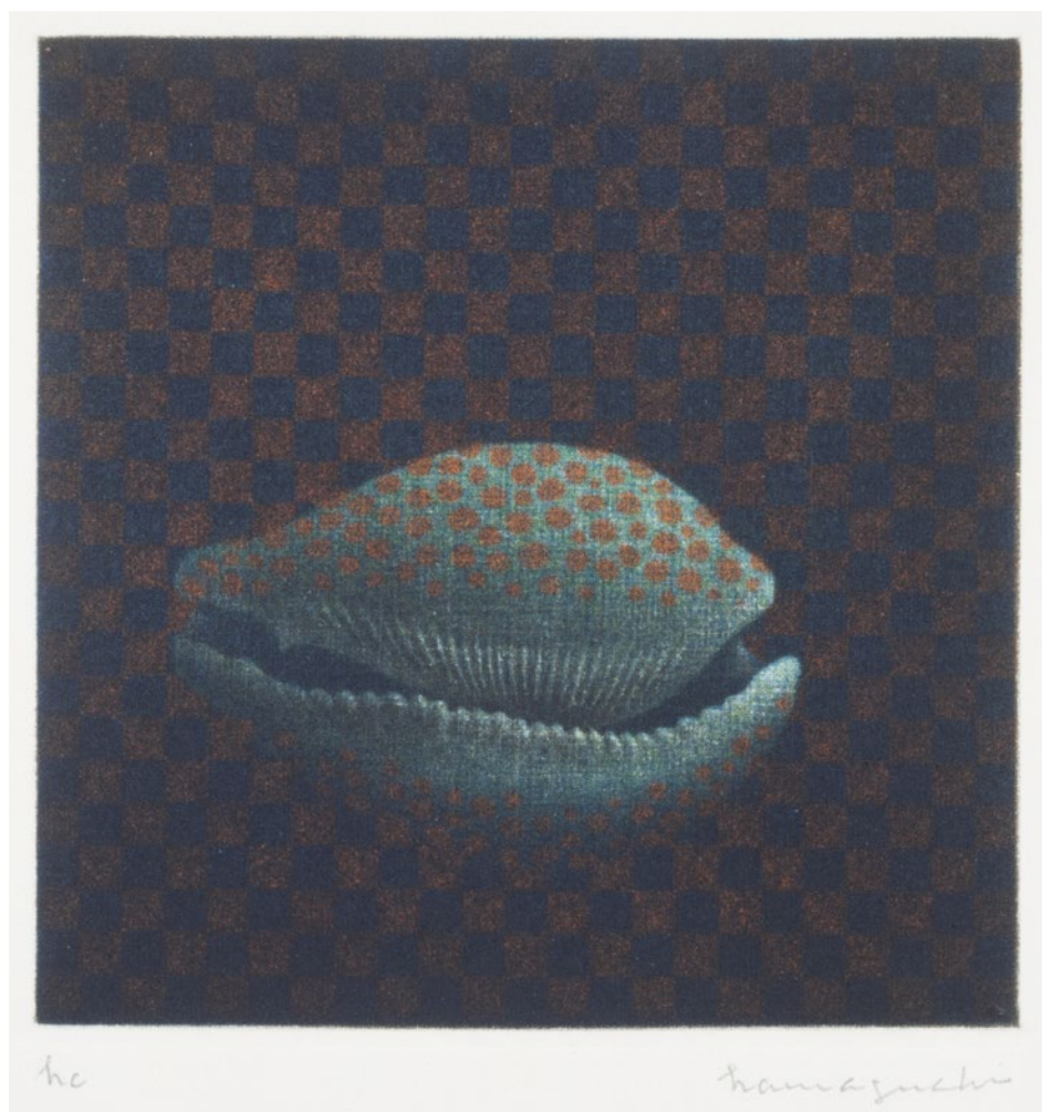
「貝」 1976年 カラーメゾチント 11.5×11.3cm