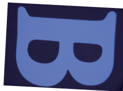
植田風に撮ってみよう...