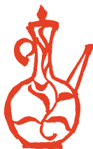
イベント制作例（デザインは変更になる場合があります）