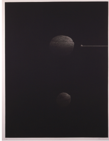
4.(後期展示) 浜口陽三『毛糸』1978年 メゾチント