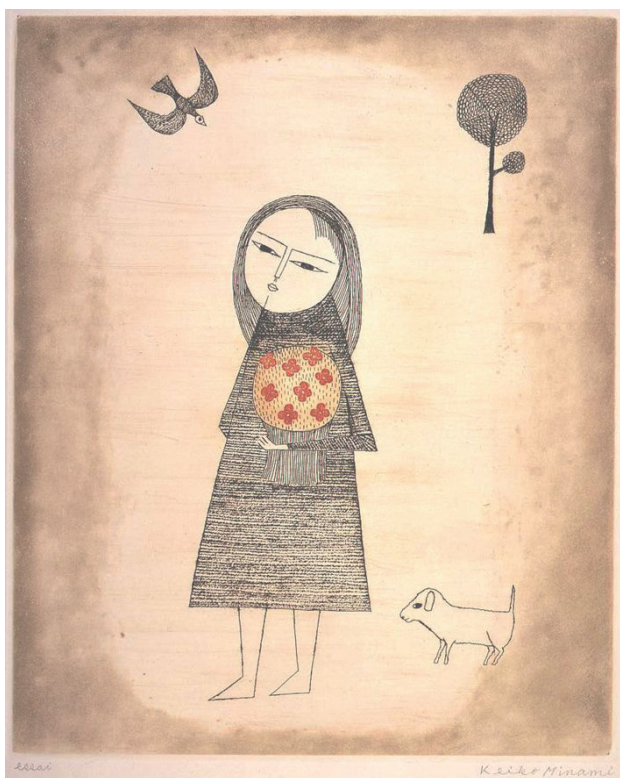
2.(後期展示) 南桂子『子供と花束と犬』1963年 エッチング、ソフトグラウンドエッチング、スピットバイト、サンドペーパー