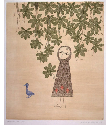
5.(前期展示) 南桂子『マロニエと少女』1975年 エッチング、サンドペーパー