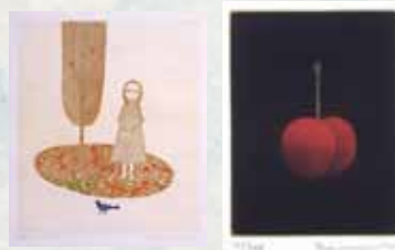
右: 浜口陽三 『ロビーナのさくらんぼ』 1981年 左: 南桂子 『ボブラの木のうで』 1980年

※作品制作の参考としての展示となっております。ワークショップ参加者のみご入館いただけます。